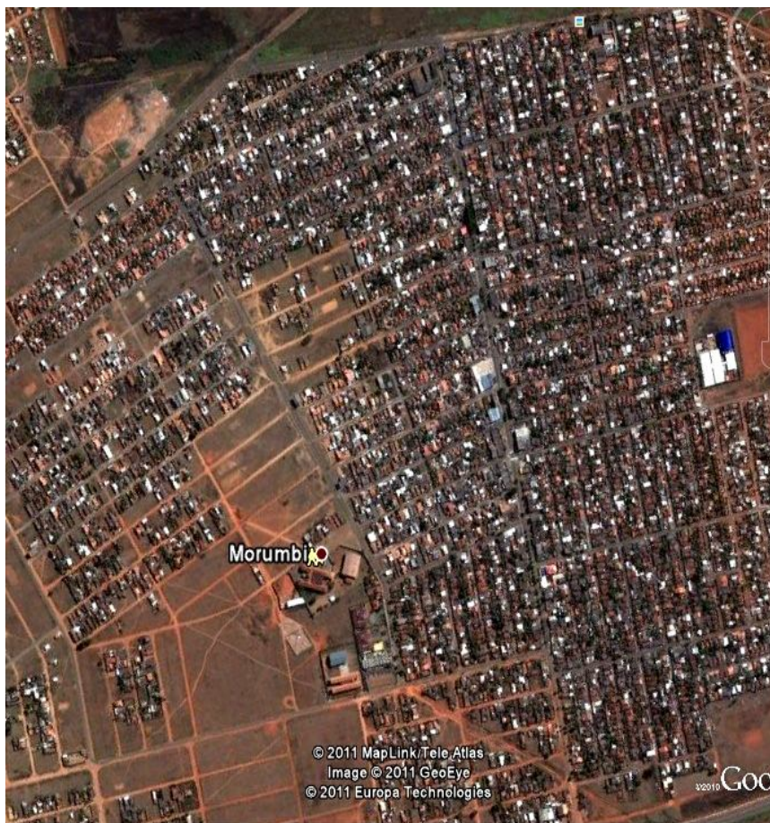
Figura 1: Bairro Morumbi, periferia de Uberlândia-MG, com localização da escola.

Assim, há que se produzir um novo olhar sobre a história da cidade, dessa gente que vive na periferia. É assim que nos países pobres, nas regiões mais pobres, nos espaços mais pobres das cidades, que a condição periférica se demonstra, de fato, como uma condição de manipulação pelas classes dominantes, pela política dominante, e agora também por uma informação que também é manipuladora.