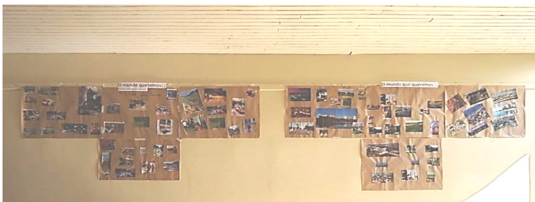
Figura 1- Painel “O mundo que temos” e o “O mundo que queremos”.

Também foi possível perceber que na elaboração do primeiro painel sobre “o mundo que temos” os alunos apresentaram poucas dificuldades em identificar nas revistas e jornais imagens que retratassem problemas urbanos. Já no segundo painel com título “o mundo que queremos” os alunos demonstraram dificuldades em pensar e encontrar imagens representando o “seu mundo ideal”. Em certa medida isso ocorreu devido ao fato de termos trabalhado e realizado durante as aulas expositivas indicações sobre exemplos de problemas urbanos e como não apresentamos possíveis modelos de cidades, no segundo painel os alunos precisaram debater com o seu grupo e refletir sobre que aspectos a “sua cidade” deveria contemplar. Neste último painel, repetiram-se imagens retratando o mundo moderno, conservação do meio ambiente e a infraestrutura urbana de qualidade, como pavimentação, praças, etc. Ao fim do trabalho, o painel construído pelos alunos ficou em exposição no pátio da escola.