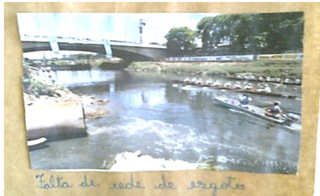
Figura 2 - Imagem representando a falta de rede de tratamento de esgoto.