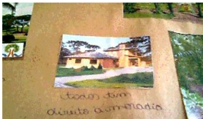
Figura 4 - Imagem representando o ideal de cidade moderna. Foto:L.L. de JESUS, 2013