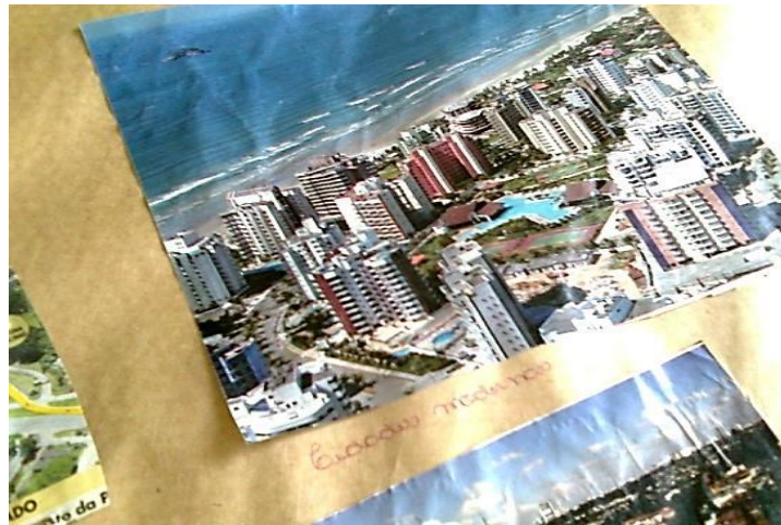
Figura 5 – Imagem representando o acesso universal à moradia.

A realização deste trabalho em sala de aula nos proporcionou um contato mais próximo com a prática da dinâmica do trabalho em grupo e a efetivação de práticas diferenciadas que quebram a rotina do cotidiano da sala de aula. Estas atividades são muito importantes, pois são capazes de mobilizar os alunos a ter um maior envolvimento nas atividades propostas pelo professor e também estimulam a sociabilidade e a construção de conhecimentos em conjunto. Notamos esses elementos durante a definição de quais imagens seriam escolhidas para compor o painel e da discussão entre os alunos para definir o conteúdo da legenda.