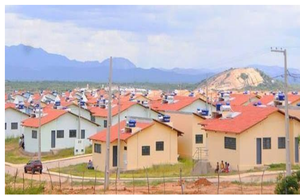
Figura 2. Conjunto residencial Itatiunga.