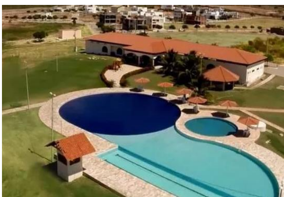
Figura 1: Condomínio Villas do Lago

Concluídas as aulas teóricas sobre a temática da desigualdade social os alunos foram conduzidos a observarem in loco e a realizarem entrevistas junto a moradores de dois grupos – Condomínio Villas do Lago e Conjunto residencial Itatiunga, mostrados nas Figuras 1 e 2.